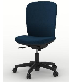
ハイバック事務椅子 KT-350PV-T1B2(イトーキ) 数量 5 470W*575D*905H * 張地は抗ウイルス素材とする。