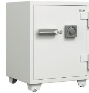
金庫 ダイヤルロック型 GEH-6108F-WE(イトーキ) 数量 1 610W*573D*795H * 耐火性能は一般紙2時間耐火とする。