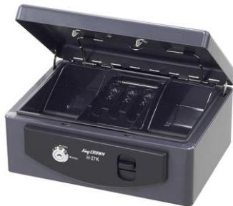
手提げ金庫 RH-27K-G(イトーキ) 数量 1 272W*209D*118H