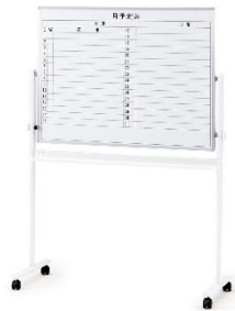
画像はイメージです。 実際の製品とは異なります。