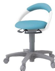
サポートスツール PCK-1100DL-S4(イトーキ) 数量 1 485W*445D*625H * 張地は、耐アルコール・次亜塩素酸とする。