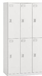
6人用ロッカー HCE-0932SS-W9(イトーキ) 数量 5 900W*515D*1790H