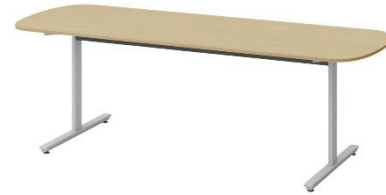
テーブルT字脚両R型 T字脚／両R／アジャスター／塗装脚／配線なし DCR-187RNNTA-ZX(イトーキ) 数量 1 1800W*750D*720H *天板は抗菌メラミン化粧板とする。