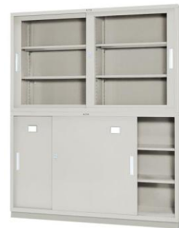
保管庫 53JWSETN-WE(イトーキ) 数量 1 1500W*400D*1820H