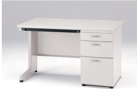
片袖デスク CZN-127CAB-W9W9(イトーキ) 数量 5 1200W*700D*700H * 天板メラミン化粧板 本体はスチール塗装性とする。