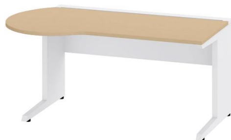
メディデスクHS片Rラウンド JHS-168FL-92(イトーキ) 数量 1 1600W*830D*720H * 幕板下はH360とし壁コンセントに支障がないものとする。