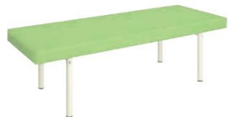
診察台 PTB-187060DL-L8(イトーキ) 数量 1 700W*1800D*600H