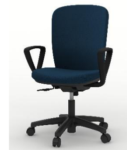
ハイバック事務椅子 ループ肘付 KT-356PV-T1B2(イトーキ) 数量 2 575W*575D*905H