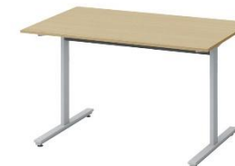
オリゴテーブルT字脚角型 DCR-127HNTTC-ZX 数量 1 1200W*750D*720H * 片側キャスター付、天板は抗菌メラミン化粧板とする。